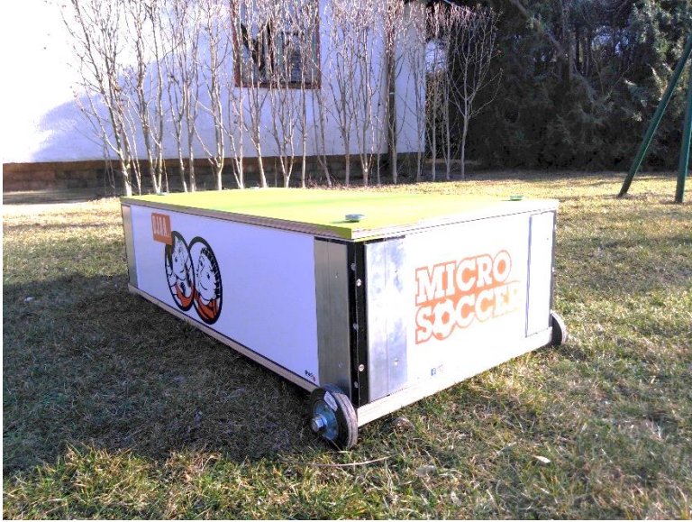
Die Box beim Transport.