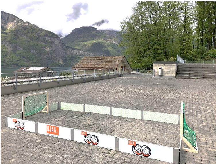
Die Box im aufgebauten Zustand.