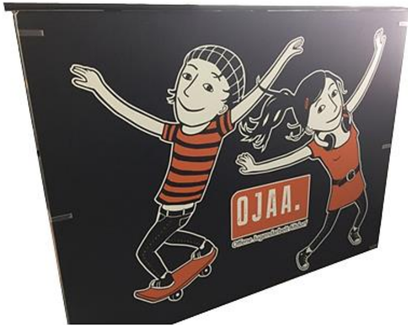
Aufbau Topper (nicht zwingend)